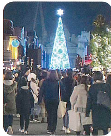
幻想的な巨大クリスマスツリー

当日は、天候にも恵まれ124名の参加がありました。朝の8時頃に集合しバス4台で出発しました。参加者の中には、USJに初めて行く方もいれば、年間バスを持っている常連の方もおられました。USJでは、注目のハリポットのホグワーツ城や季節限定の幻想的な巨大なクリスマスツリーなど、各々楽しんでいただけました。