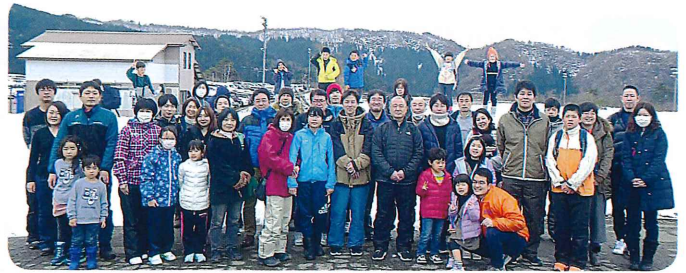
集合写真 @ SKI JAM勝山にて

2月15日(土)に草津・栗東地区労福協にて、日帰りスキーツアー(福井県SKI JAM勝山)を開催しました。今年は異例の暖冬の中、実施も危ぶまれましたが、何とか雪も残り実施することができました。しかしながら、参加者は、雪不足と新型コロナウイルス等の影響により、昨年比半減の49名となりました。