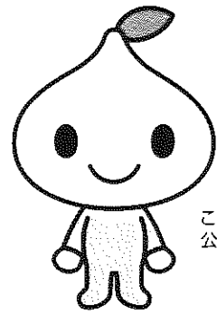
こくみん共済 coop 公式キャラクター ビットくん

たすけあいの輪をむすぶ こくみん共済〈全労済〉 全国労働者共済生活協同組合連合会 COOP