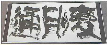
書道の部【特選】 知事賞 受賞 木村 志呂様『変則通』