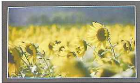
写真の部【特選】 大津市長賞 受賞 古賀 竜太郎様 『花粉さがし』