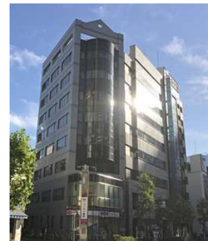
中央労福協が入居する中北ビル (東京都千代田区神田小川町)