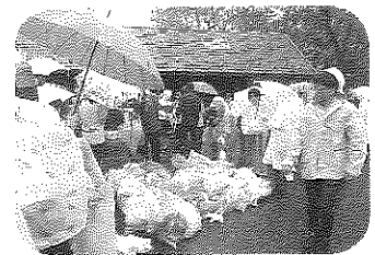
台風の影響で浮遊物が多かったです。 BBQ後の置き去りゴミも…【近江八幡】

本年度も、夏休みの終わった9月9日を基軸（近江八幡地区は9月8日、湖北地域は9月23日）に、琵琶湖を中心とした一斉清掃活動「びわ湖クリーンキャンペーン」を行いました。県下180組合から2722名が参加し、運動会シーズンでもある中、お子様と一緒に作業をするご家族も多く見受けられました。一時的に雨足が強まる等不安定な天候の中、雨宿りをしたり活動時間を短縮するなど、空を見上げながら琵琶湖岸や流域河川周辺を中心に清掃活動を行いました。