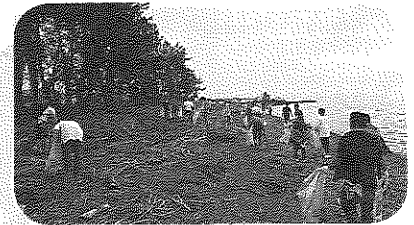
子どもたちも多く参加してくれました！【彦根】