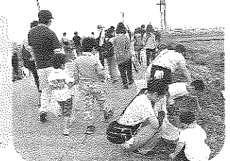
開始直後の雨… 雨の中がんばりました！【東近江】