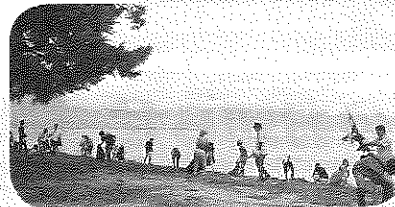
子どもたちも枝を集めたり～ がんばりました！【守山野洲】