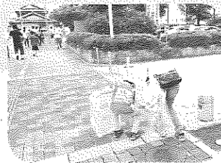
一般企業・市民の方も参加い ただきました！【草津栗東】