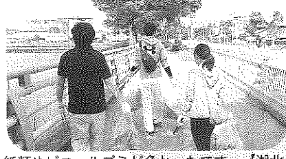
紙類やビニールゴミが多かったです…【湖北】