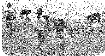
ドローンが落ちていたのにはビックリ。。【高島】