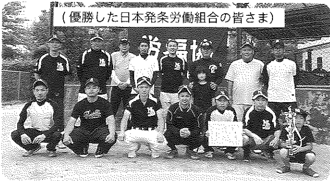
(優勝した日本発条労働組合の皆さま)

勤労者の体育向上と働く仲間の連帯を強めるため、来年度も各地区労福協と連携し、当事業を継続開催してまいりたいと思います。