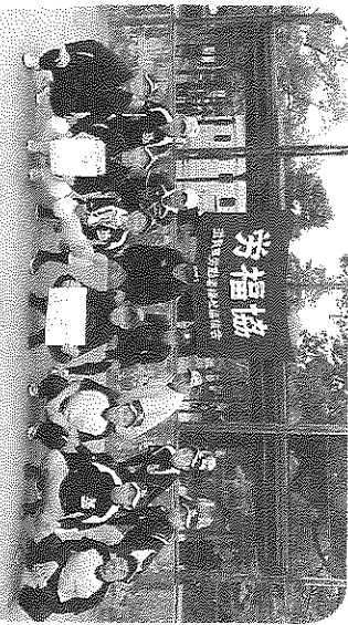
(連覇を果たした『日本発条労働組合』選手の皆さま)

本年度は、9地区より14チームの参加のもと熱戦が繰り広げられました。総勢228名が集い、フラインジーや接戦にスタッツも興奮する大会となりました。決勝戦は湖南甲賀地区代表2チームの戦いとなり、結果、4試合を制した日本発条労働組合チーム(対ナス鋼帯労働組合チーム)が2連覇を果たしました。また、2013年から5年ぶりに出場となる高島労福協が強豪を破り初戦突破した試合も印象的でした。どのチームも走攻守の光るプレーと見事なチームワークで、観る者も一喜一憂する大変有意義な時間を過ごすことができました。