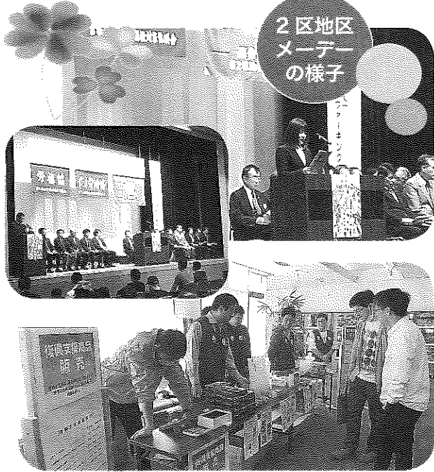
2区地区メーデーの様子