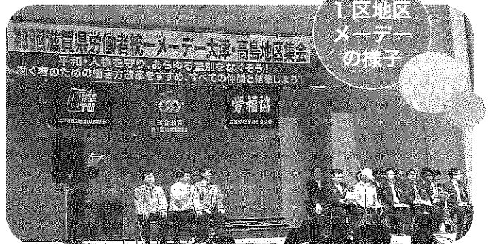
1区地区メーデーの様子

メーデー集会は働く者が集う祭典とした運動を基盤に、広く社会にアピールしております。来年も多くの方々のご参加をお待ちしております。