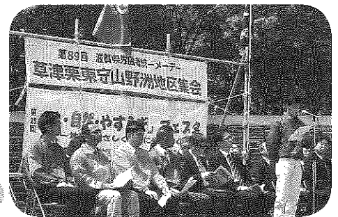
3区地区メーデーの様子

会場の外では震災復興を目的とした復興支援商品の販売やパネル展示、また子供イベントコーナーなど多くの方々で最後まで賑わっていました。